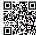
矮人礦坑 桌遊教學影片