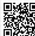
牛頭人 桌遊教學影片